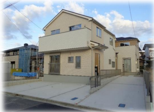
隣地に囲まれない、明るく開放的なお家

土地面積：135.69㎡ (41.04坪) 建物面積：94.41㎡ (28.55坪)