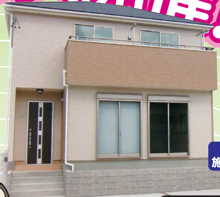
写真は 施工例です。