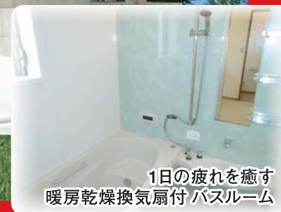
1日の疲れを癒す 暖房乾燥換気扇付 バスルーム