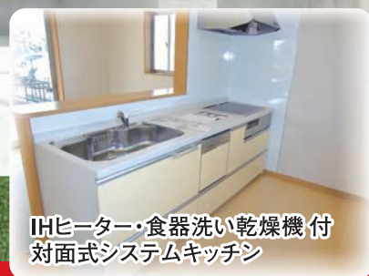
IHヒーター・食器洗い乾燥機付 対面式システムキッチン