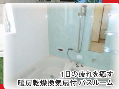
1日の疲れを癒す 暖房乾燥換気扇付 バスルーム