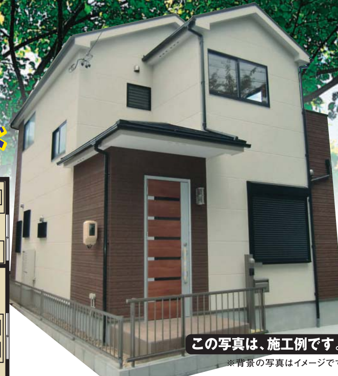
この写真は、施工例です。 ※背景の写真はイメージです。