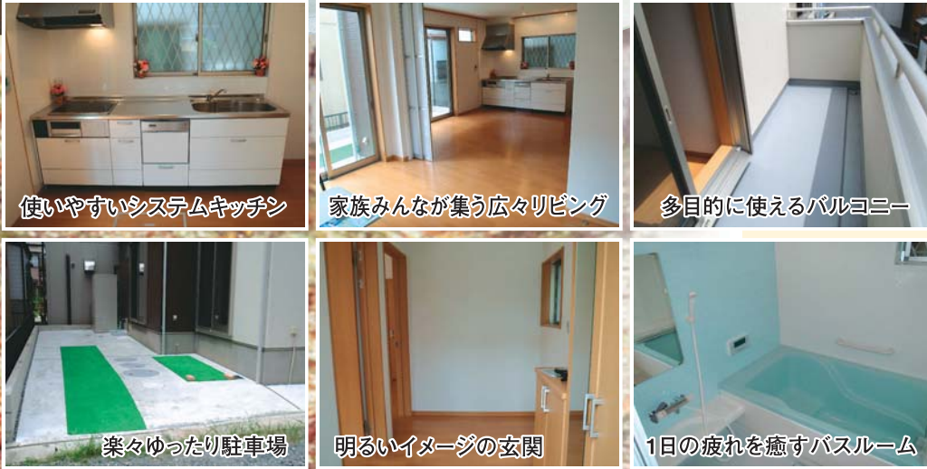
使いやすいシステムキッチン 家族みんなが集う広々リビング 多目的に使えるバルコニー 楽々ゆったり駐車場 明るいイメージの玄関 1日の疲れを癒すバスルーム

現地までのNAVIGATION ●お車でお越しの方は、カーナビに 「北名古屋市片場白山49-6」 ●検索方法はメーカー・モデルにより異なります。と入力して検索してください。