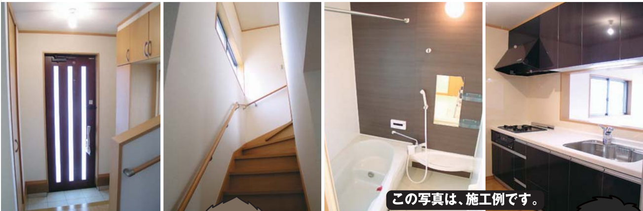
この写真は、施工例です。