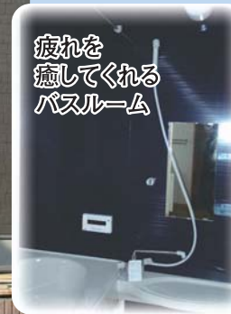
疲れを癒してくれるバスルーム