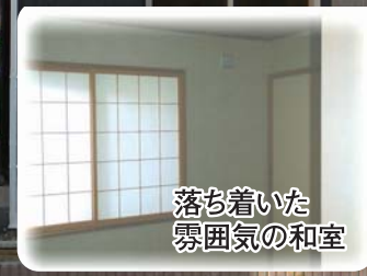
落ち着いた雰囲気のと室