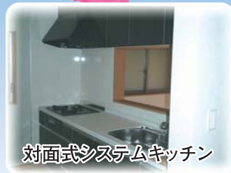
対面式システムキッチン