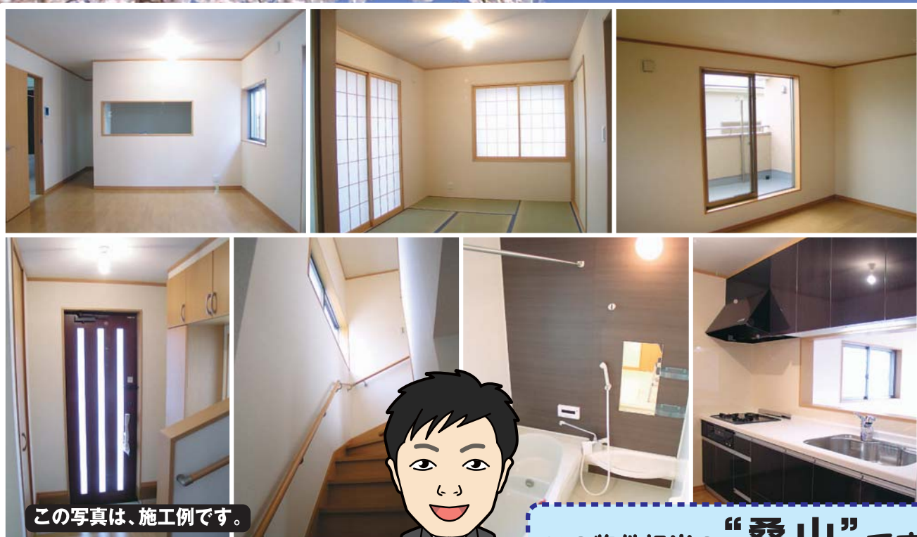
この写真は、施工例です。

■物件概要 ●所在地/名古屋市守山区森孝一丁目808番 ●交通/地下鉄東山線「藤が丘」駅徒歩42分、市バス乗車11分「引山東」停徒歩7分 ●建物構造/木造サイディングス2階建 ●土地権利/所有権 ●地目/畑(引渡時までに宅地に変更いたします) ●都市計画/市街化区域 ●用途地域/第1種住居地域 ●建ぺい率/60% ●容積率/200% ●築年月/平成22年5月中旬完成予定 ●駐車場/2台可能 ●現況/建築中 ●引渡日/平成22年5月中旬予定 ●接道状況/北側幅員3.00mの公道に接面(セットバック0.5m有り) ●設備/上下水道、東邦ガス、雨水(側溝)、中部電力 ●取引形態/仲介