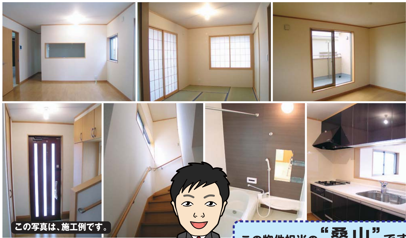
この写真は、施工例です。