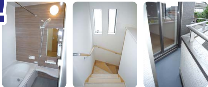
浴室(換気乾燥機付) 階段 バルコニー