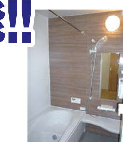
浴室(換気乾燥機付)