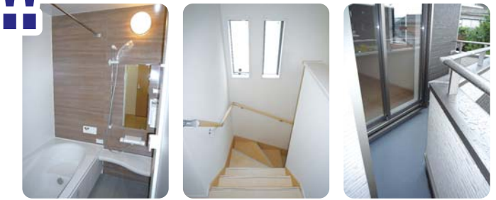
浴室(換気乾燥機付)