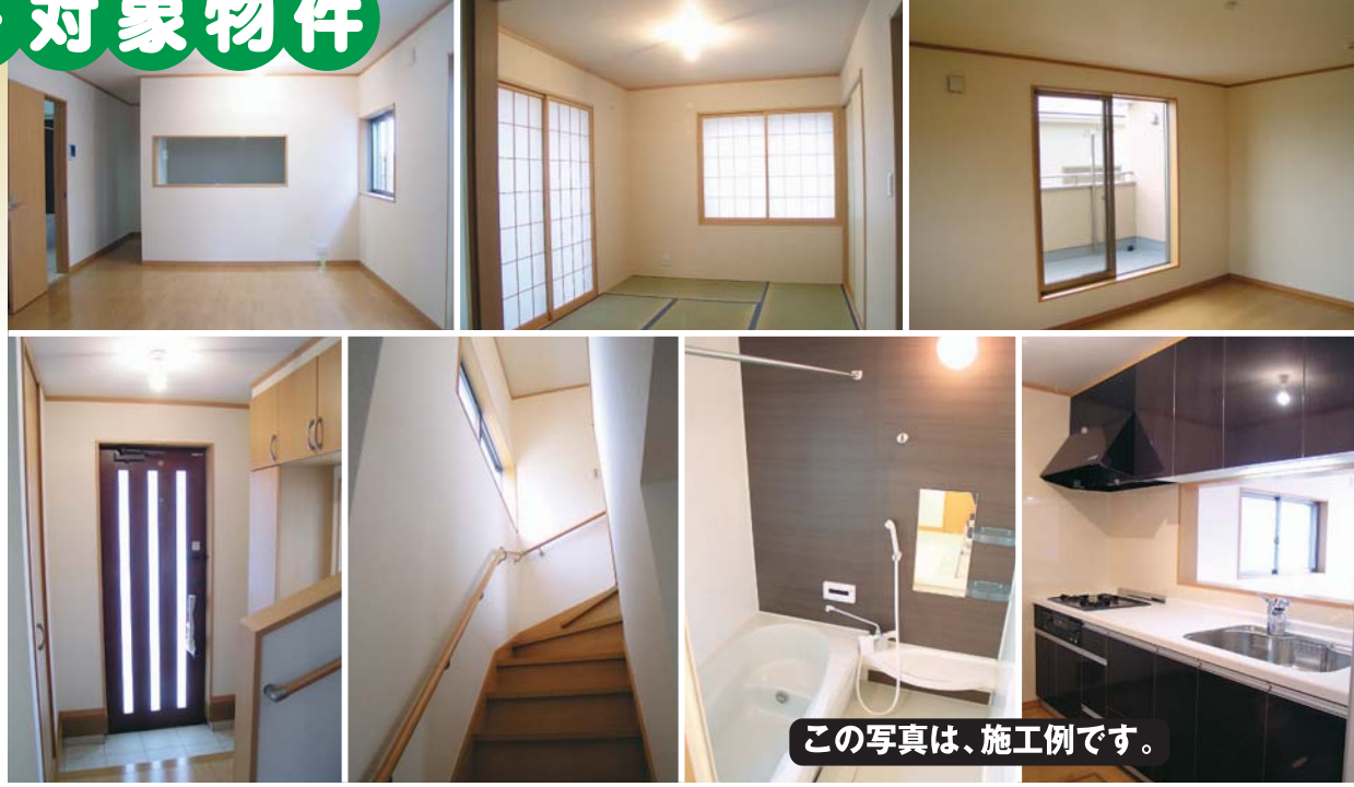
この写真は、施工例です。