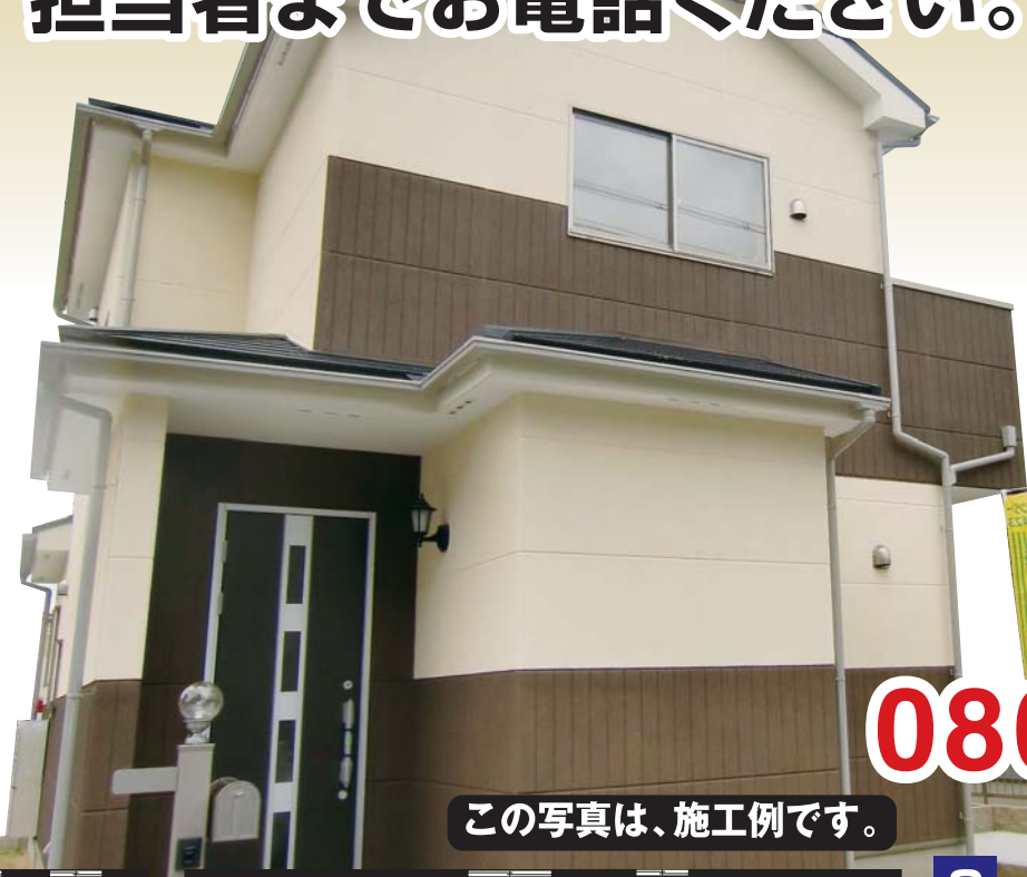
この写真は、施工例です。