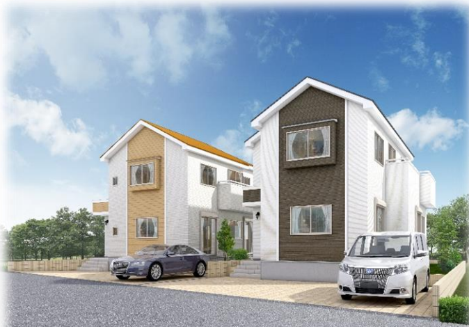
完成済みモデルハウスへご案内致します。

開催時間 AM10:00~PM18:00 今週の、6/16(土)・6/17(日) 平日も随時ご案内いたします。お気軽にお問合せ下さい。