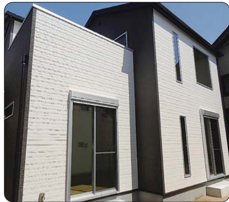
Designo House 建築施工例