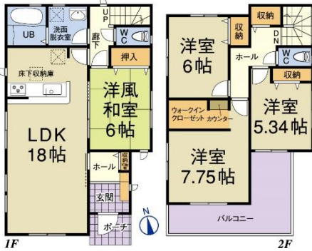
1号棟 土地面積: 224.89㎡ (67.96坪) 建物面積: 106.00㎡ (32.06坪)

開催日時 AM10:00~PM17:00 今週の11/18(土)・19(日) 平日もお気軽にお問合せ下さい