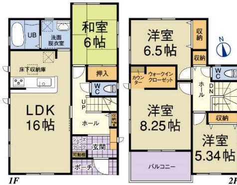
2号棟 土地面積: 250.07㎡ (75.64坪) 建物面積: 106.00㎡ (32.06坪)