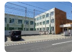
山田東中学校 徒歩940m

■所在地:名古屋市西区清里町 ■交通:地下鉄鶴舞線「上小田井」駅徒歩23分 ■構造:木造2階建 ■土地権利:所有権 ■都市計画:市街化区域 ■用途地域:第1種中高層住居専用地域 ■建ぺい率:60%容積率:200% ■接道状況:東側幅員約7.9mの公道に接面 ■設備:中部電力・公営水道・都市ガス・公共下水 ■完成:平成29年1月完成 ■引渡:相談 ■建築確認番号:第KS116-0510-02245号 ■取引形態:媒介 ■チラシ有効期限:1ヶ月