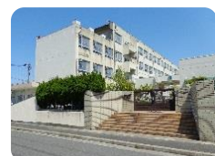
比良西小学校 徒歩230m