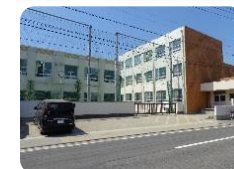
山田東中学校 徒歩940m

■所在地:名古屋市西区清里町 ■交通: 地下鉄鶴舞線「上小田井」駅徒歩23分 ■構造: 木造2階建 ■土地権利: 所有権 ■都市計画: 市街化区域 ■用途地域: 第1種中高層住居専用地域 ■建ぺい率 60%容積率 200% ■接道状況: 東側幅員約7.9mの公道に接面 ■設備: 中部電力・公営水道・都市ガス・公共下水 ■完成: 平成29年1月完成 ■引渡: 相談 ■建築確認番号: 第KS116-0510-02245号 ■取引形態: 媒介 ■チラシ有効期限: 1ヶ月