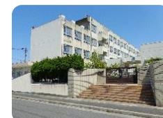
比良西小学校 徒歩230m