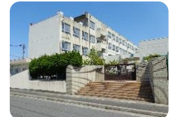
比良西小学校 徒歩230m