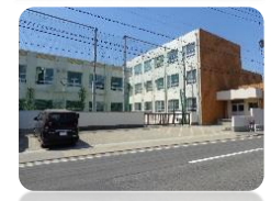
山田東中学校 徒歩940m

■所在地:名古屋市西区清里町 ■交通:地下鉄鶴舞線「上小田井」駅徒歩23分 ■構造:木造2階建 ■土地権利:所有権 ■都市計画:市街化区域 ■用途地域:第1種中高層住居専用地域 ■建ぺい率:60%容積率:200% ■接道状況:東側幅員約7.9mの公道に接面 ■設備:中部電力・公営水道・都市ガス・公共下水 ■完成:平成29年1月完成 ■引渡:相談 ■建築確認番号:第KS116-0510-02245号 ■取引形態:媒介 ■チラシ有効期限:1ヶ月