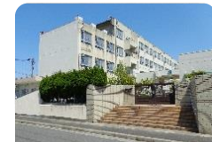
比良西小学校 徒歩230m