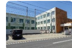
山田東中学校 徒歩940m